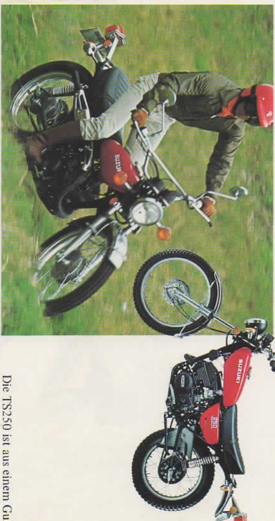
Die TS250 ist aus einem Guß.

Probieren Sie aus, wie leicht Sie die neuen Weichgummigriffe in den Griff bekommen! Und erst die bequeme Schalteranordnung – Beleuchtung, Abblendregler, Fahrtrichtungsanzeiger, Hupe: jederzeit in Reichweite! Ein Cockpit ohne Kompromisse.